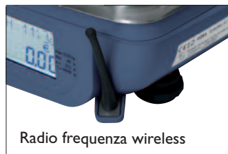
Radio frequenza wireless